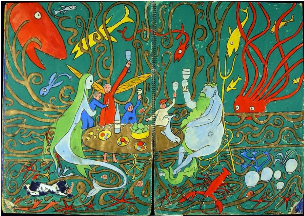
Extrait de la Bildergeschichte