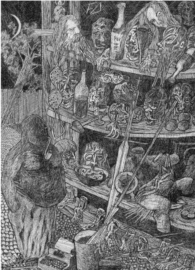
Das Arsenal des Dramatikers/L'arsenal du dramaturge, 1960.

Cet atelier propose aux étudiant.e.s de découvrir ou d'approfondir leurs connaissances de Friedrich Dürrenmatt. Six thèmes, traitant par exemple de la littérature, de la peinture ou de l'architecture du Centre Dürrenmatt, sont abordés par groupe durant l'atelier.