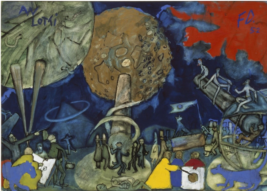
Die Astronomen/Les astronomes, 39.5 cm × 55.5 cm, Gouache/gouache, 1952.

L'enseignant.e a la possibilité d'introduire Friedrich Dürrenmatt et le Centre Dürrenmatt Neuchâtel à sa classe à l'aide du Kit pédagogique.