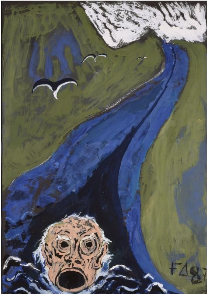
Der singende Kopf des Orpheus treibt den Styx hinunter/Tête d'Orphée chantant et descendant au fil du Styx, 1987.

L'enseignant.e a la possibilité d'introduire Friedrich Dürrenmatt et le Centre Dürrenmatt Neuchâtel à sa classe à l'aide du Kit pédagogique.