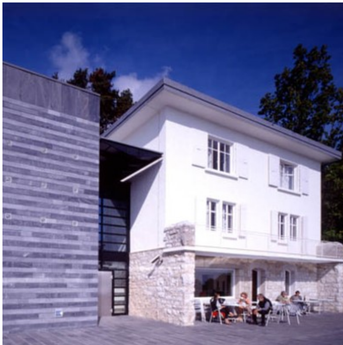
L'ancienne maison de Friedrich Dürrenmatt et le bâtiment du CDN conçu par Mario Botta.