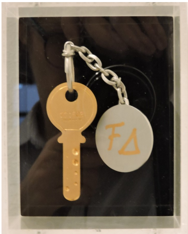
Ancienne clé de la maison de la famille Dürrenmatt.

L'enseignant.e a la possibilité d'introduire Friedrich Dürrenmatt et le Centre Dürrenmatt Neuchâtel à sa classe à l'aide du Kit pédagogique.